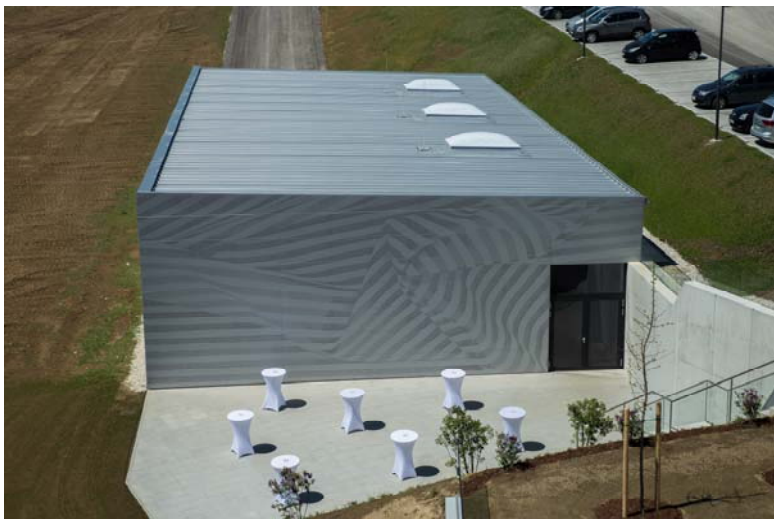
Schulungshalle „Home of Innovation for Metal Buildings“