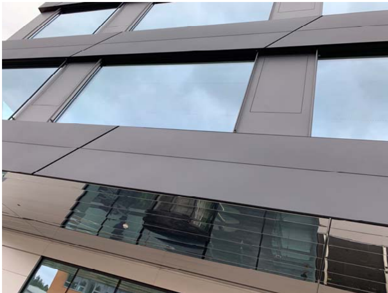
An der Fassade zeigt sich die Kompetenz des Metallbaubetriebs. Paneele mit integrierten Lüftungsflügeln ermöglichen ein natürliches Raumklima.