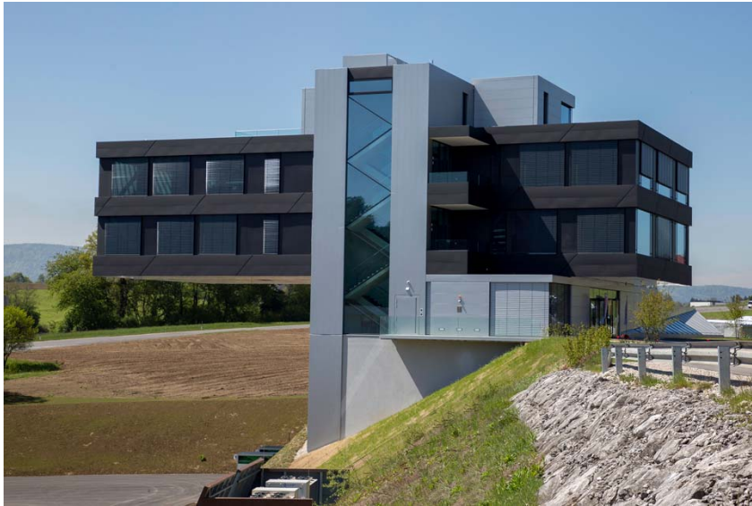
DOMICO Kunden- und Kompetenzzentrum